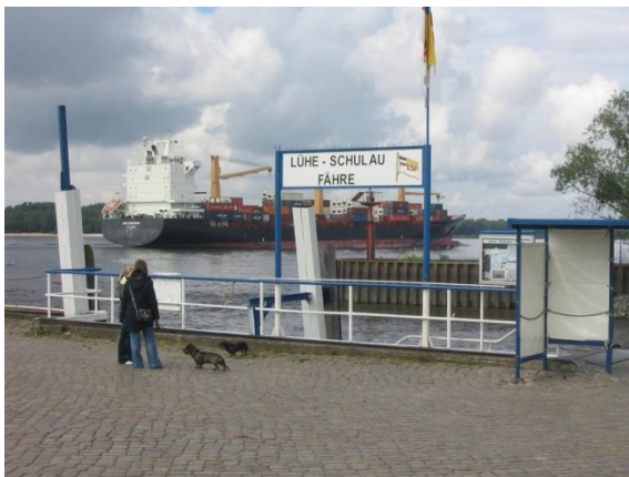
Der Fähranleger in Wedel

www.verlag-ludwig.de (ISBN 978-3-937719-82-5)