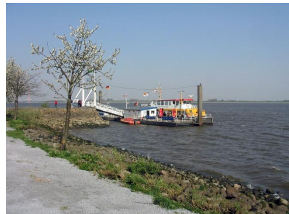
Der Fähranleger in Lühe