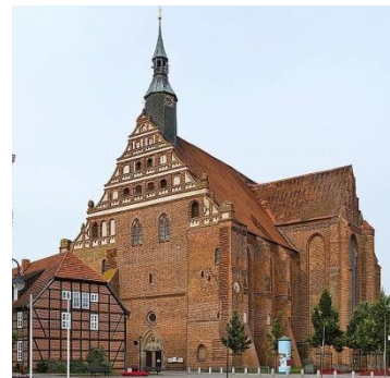
Die Wunderblutkirche in Bad Wilsnack

In der Wunderblutkirche zeugt heute noch der Wunderblutschrein aus dem 15. Jahrhundert von dieser Zeit. Mit der Zerstörung der "wundertätigen" Hostien während der Reformation fiel die Stadt in die Bedeutungslosigkeit zurück.