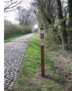
Der „Krumme Weg“ - Beginn der Via Jutlandica an der dänisch/deutschen Grenze nahe Flensburg

Freundeskreis der Jakobswege in Norddeutschland